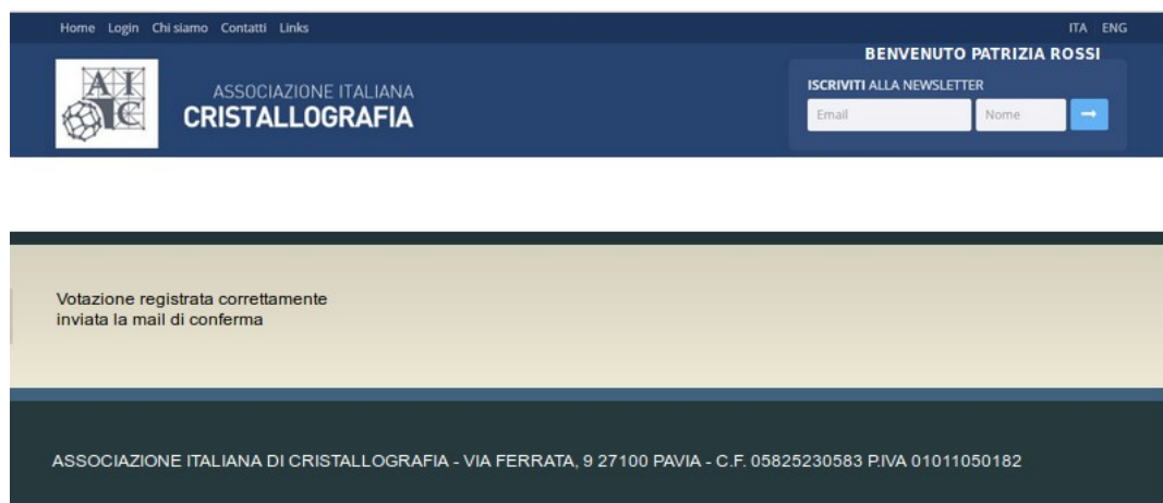
Figura 7: La procedura è finita il voto è stato registrato.