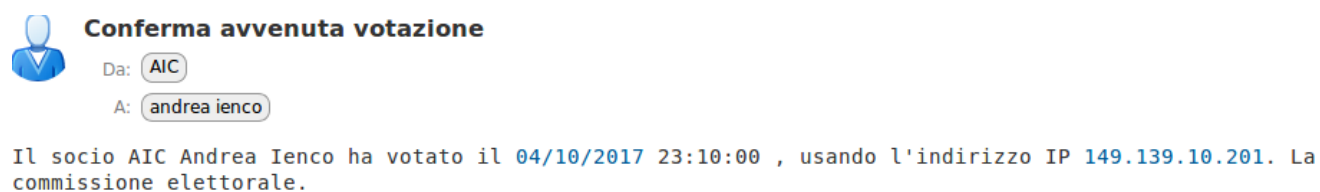
Figura 8: La mail di conferma.